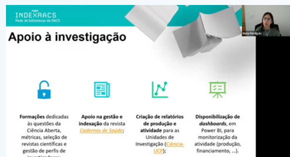
Painel II - “Formação de utilizadores - o que se faz, como se faz?”